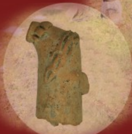
Σκελετός Ποντοκώμης Πόλυοι γυναικεία ειδώλια, 4800 π.χ.